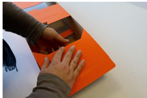
4 innere Rille runterfalten