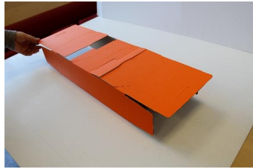
2 Box aufstellen