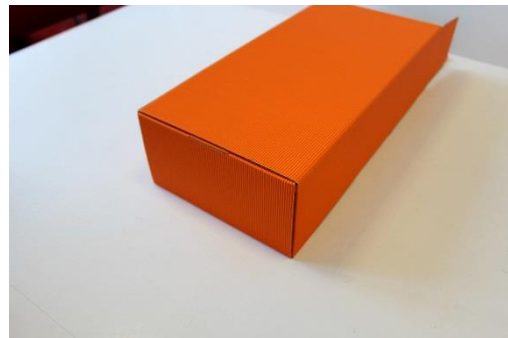
6 erste Seite fixiert