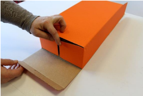
9 Box wieder umdrehen, schließen