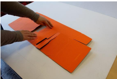
3 gut vorfalten