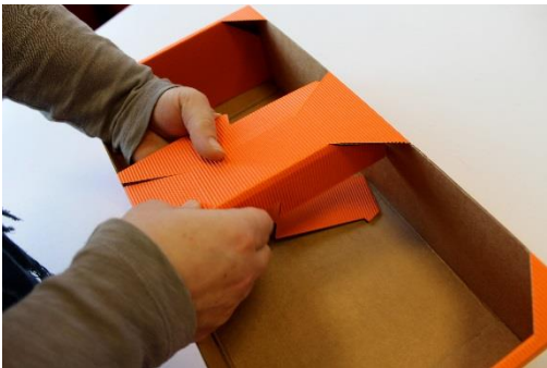
11 Griff links und rechts gut vorfalten