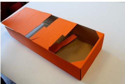
7 andere Seite