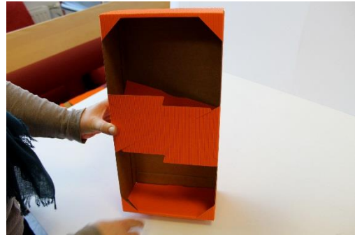
10 beide Seiten nun fixiert